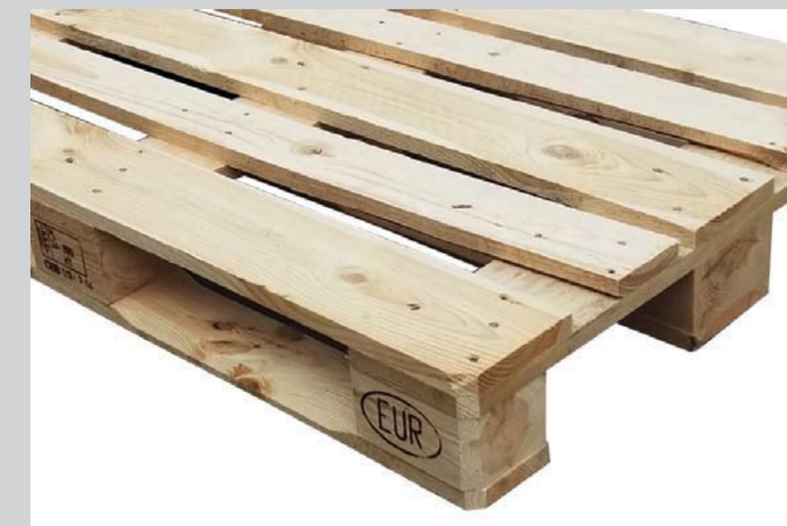
Przykładowe zdjęcie palety rocznej

Szary kolor palety, będący skutkiem naturalnego procesu starzenia się drewna, nie wpływa ujemnie na jej właściwości.