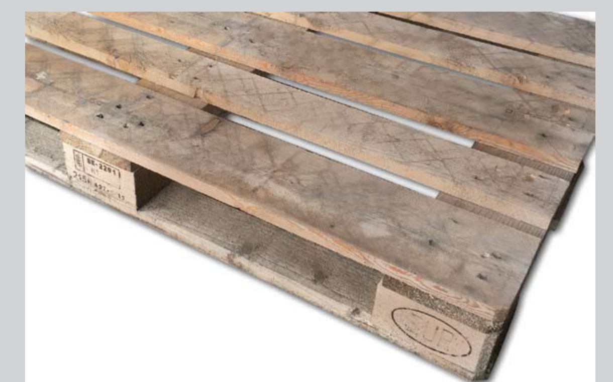
Przykładowe zdjęcie palety trzyletniej