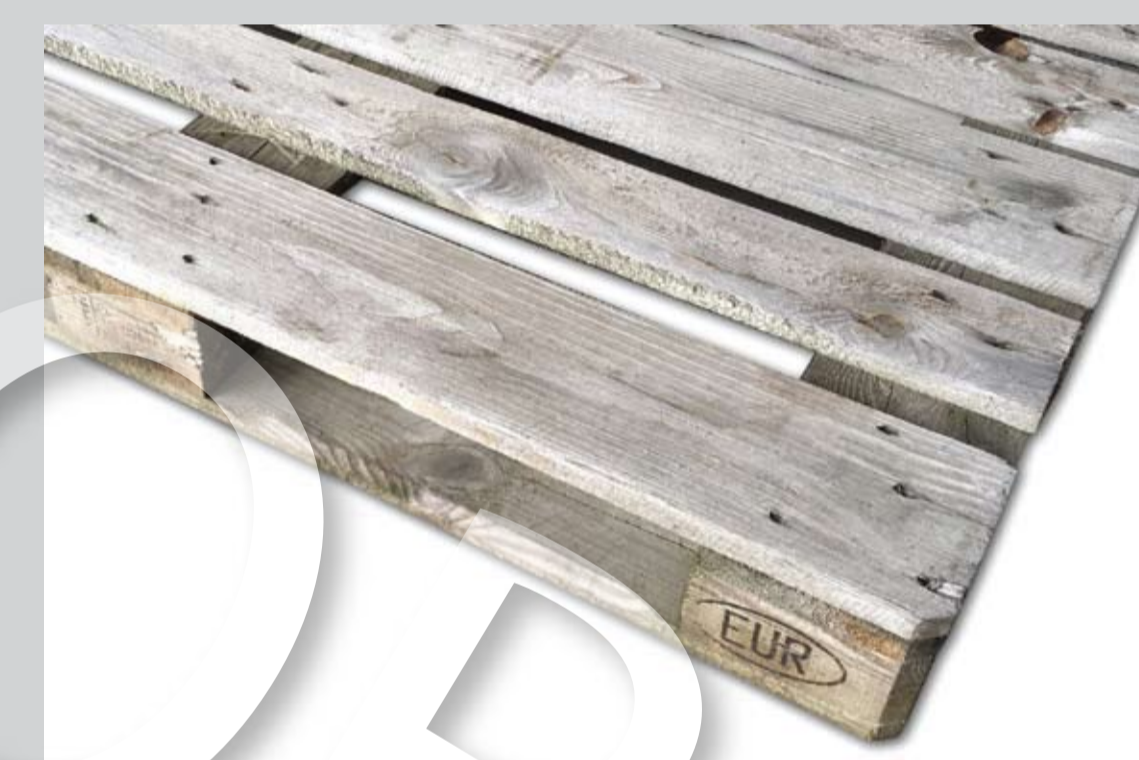
Przykładowe zdjęcie palety pięcioletniej