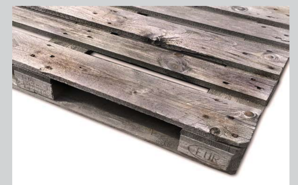
Przykładowe zdjęcie palety siedmioletniej

Palety EUR są produktem markowym i podlegają ochronie przez Ustawę Prawo Własności Przemysłowej!