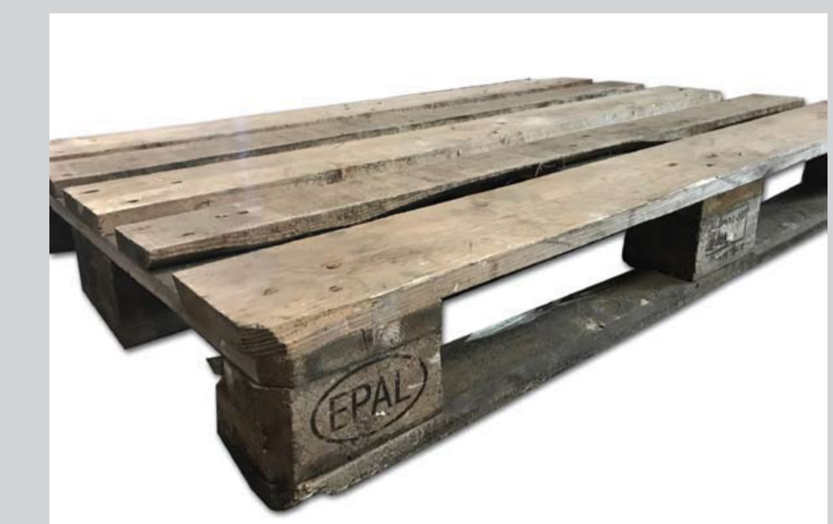
Przykładowe zdjęcie palety siedmioletniej

Palety EPAL są produktem markowym i podlegają ochronie przez Ustawę Prawo Własności Przemysłowej!