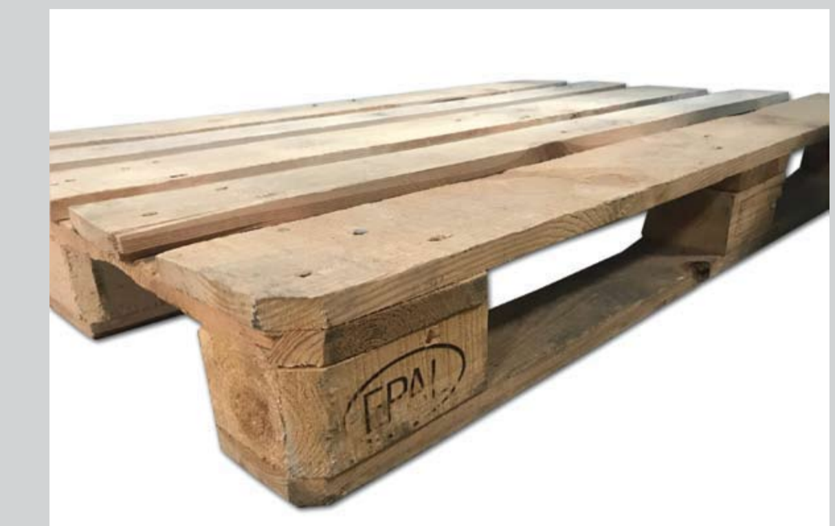
Przykładowe zdjęcie palety trzyletniej