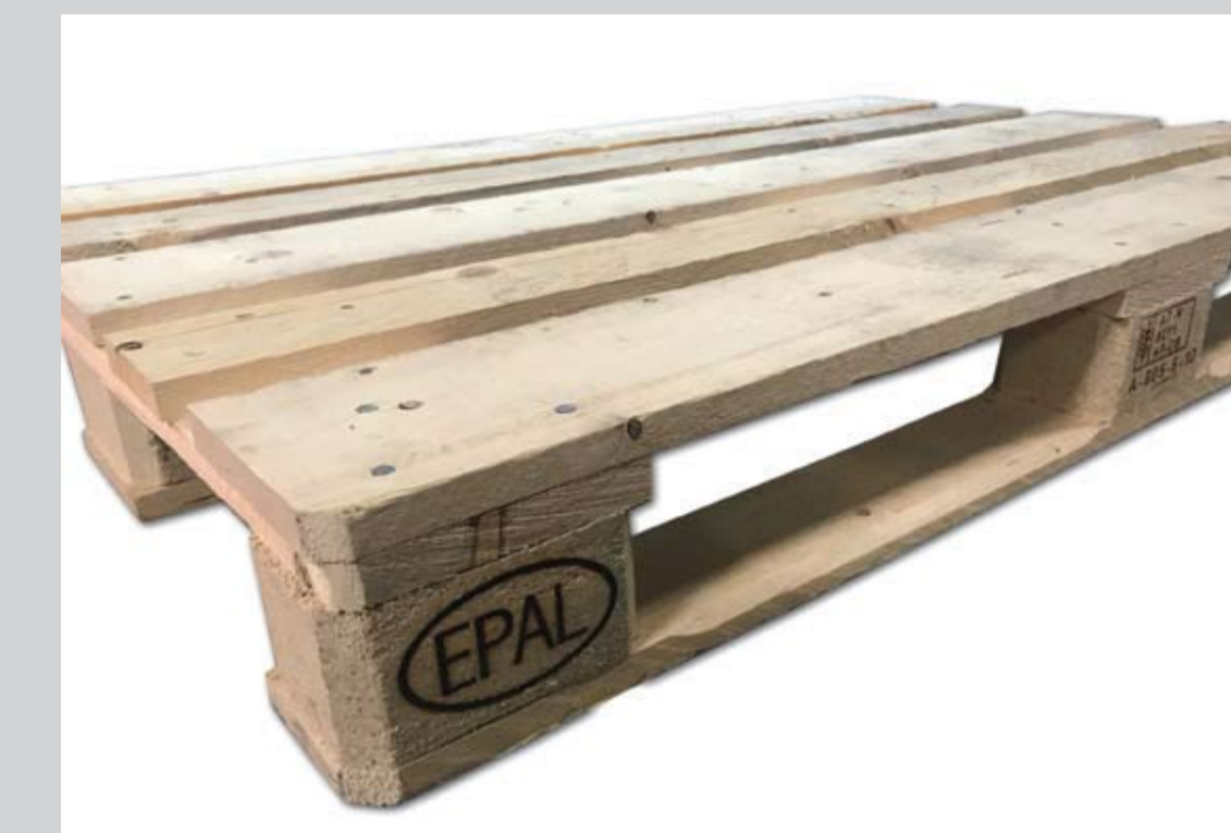
Przykładowe zdjęcie palety rocznej

Szary kolor palety, będący skutkiem naturalnego procesu starzenia się drewna, nie wpływa ujemnie na jej właściwości.