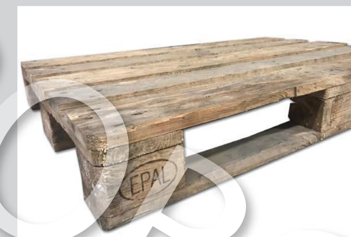
Przykładowe zdjęcie palety pięcioletniej